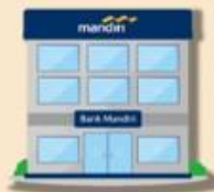
Kantor Cabang Mandiri