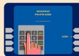
2. Masukan PIN ATM