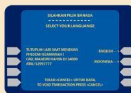
1. Pilih Bahasa