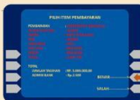
8. Konfirmasi Pembayaran 2