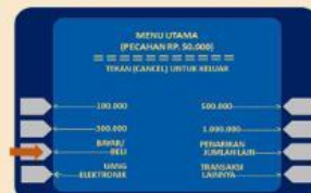
3. Pilih Menu Bayar/Beli