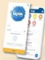
Livin' By Mandiri