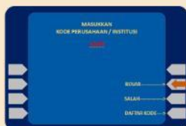
5. Masukan Kode 10059