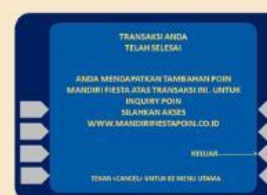
9. Transaksi Berhasil

* Note : Nomor Virtual Account adalah nomor Peserta