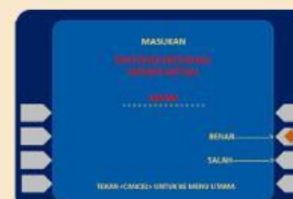
6. Masukan Nomor Virtual